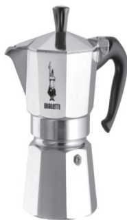
Слика 2 Мока