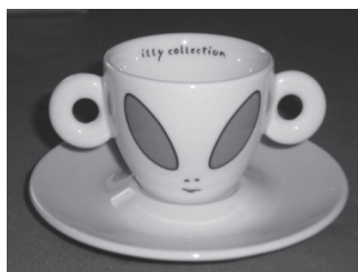
Слика 5 Дизајн Дејвида Бирна (2001)