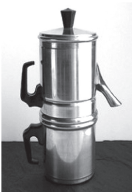
Слика 1 Наполетана

и распрострањена широм света у бројним дизајнерским варијацијама 16 .