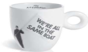
Слика 3 Дизајн Марине Абрамовић (2002);

високом естетском вредношћу доживљај кафе трансформишу у искуство које призива конзументе на дијалог и комуникацију. Италијанима се вишеструко исплатило истовремено улагање у индустрију кафе и уметност, о чему најбоље сведоче чувене колекције шољица за кафу произвођача Или ( Illy ), који од 1992. године па до данас ангажује реномиране савремене уметнике нудећи им белину порцелана уместо сликарског платна. Међу познатим именима аутора који су осмислили посебне колекције налази се и српска савремена уметница перформанса Марина Абрамовић, која је понудила дизајн шољице са својим ликом и заставом са слоганом на енглеском We are all in the same boat (срп. Сви смо у истом броду) (Слика 3), али и друге занимљиве колекције, нпр. шољице са рупицом кроз коју се гледа у унутрашњост и садржај (Слика 4). Због појединих уметника, као што је Дејвид Бирн (David Byrne) произвођач је морао и да мења постројења у фабрици, јер је овај амерички уметник тражио да се израде шољице са две дршке, нетипичне за уобичајену линију (Слика 5) 33 .