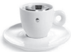
Слика 4 Дизајн Марине Абрамовић (2002); Извор: https://www.illycups.nl/contents/media/1_illy%20collection%202002%20spirit%20cup%201.jpg

Извор: https://www.illy.com/en-us/shop/accessories/illy-art-collection/illy-art-collection-marina-abramovic-mug/22544.html